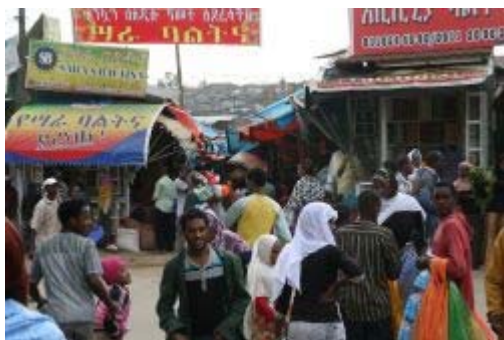
Der Merkato ist Afrikas größter Freiluftmarkt.

lächelndem Gesicht bei den sechs Leipziger Schülern für ein Studium in Gondar wirbt!