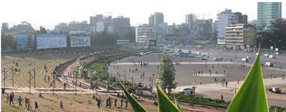
Am Meskal Platz startet auch der Great Ethiopian Run.